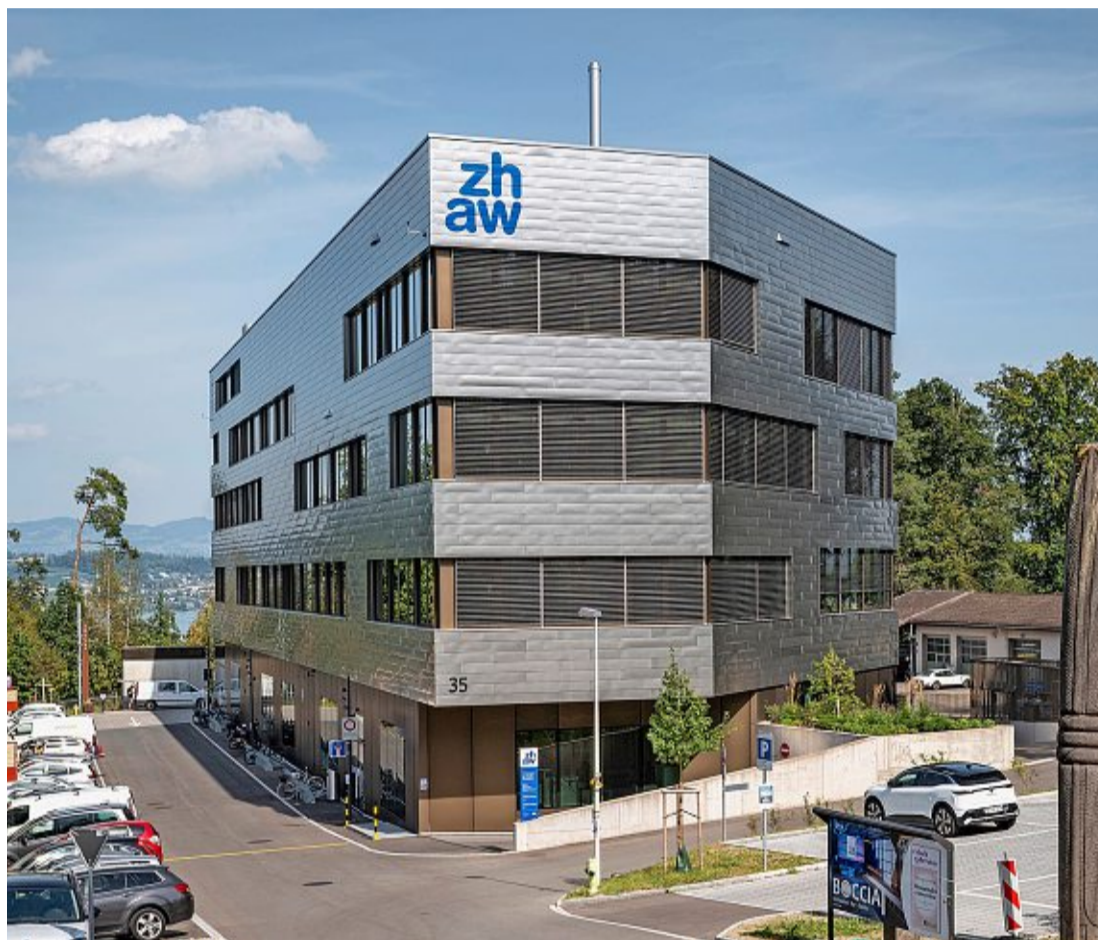
Das Gebäude glänzt im Sonnenlicht und verschafft der ZHAW internationale Ausstrahlungskraft.

Das sei einzigartig, sagte ZHAW-Direktor Jean-Marc Piveteau am Mittwoch an der Einweihung. «Die kurzen Wege sind ein grosser Vorteil.» Die Forschungsprodukte müssten so nicht mehr hin- und hertransportiert werden. Zudem fördere die Nähe den spontanen Austausch und neue kreative Ideen, «die die Lehre und Forschung weiterbringen».