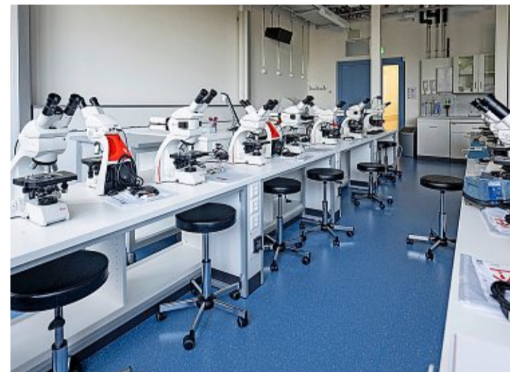
Die Mikroskope wurden just am Tag der Gebäudeeinweihung angeliefert.