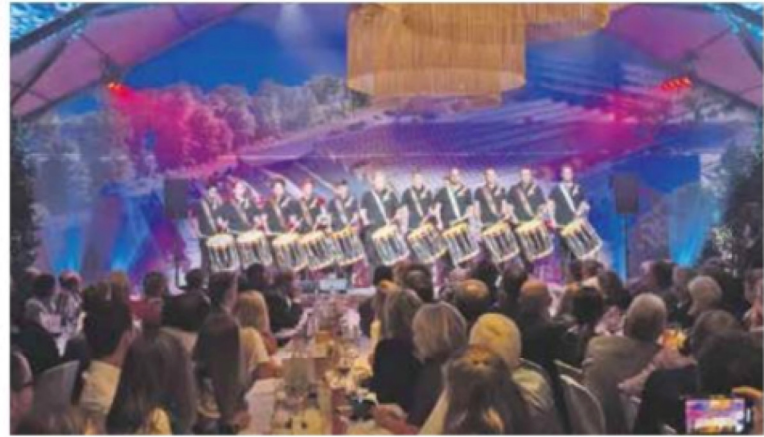
Die Wädenswiler Tambouren bei ihrem Auftritt.